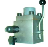
B 20 MB

Lütfen daha fazla detaylı bilgi için Teknik Departmanımıza danışınız